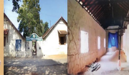
பள்ளியின் தற்போதைய தோற்றம்